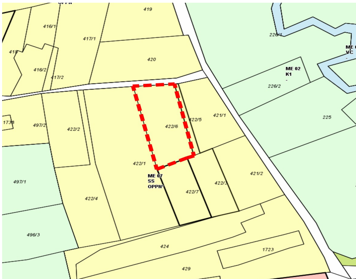
Slika 1: Izsek iz prostorskega plana

Skladno s prostorskim aktom (OPN) opredeljuje prostorsko enoto, v kateri se izvaja OPPN za območje EUP ME 07 kot območje, ki je namenjeno stanovanjskim površinam.